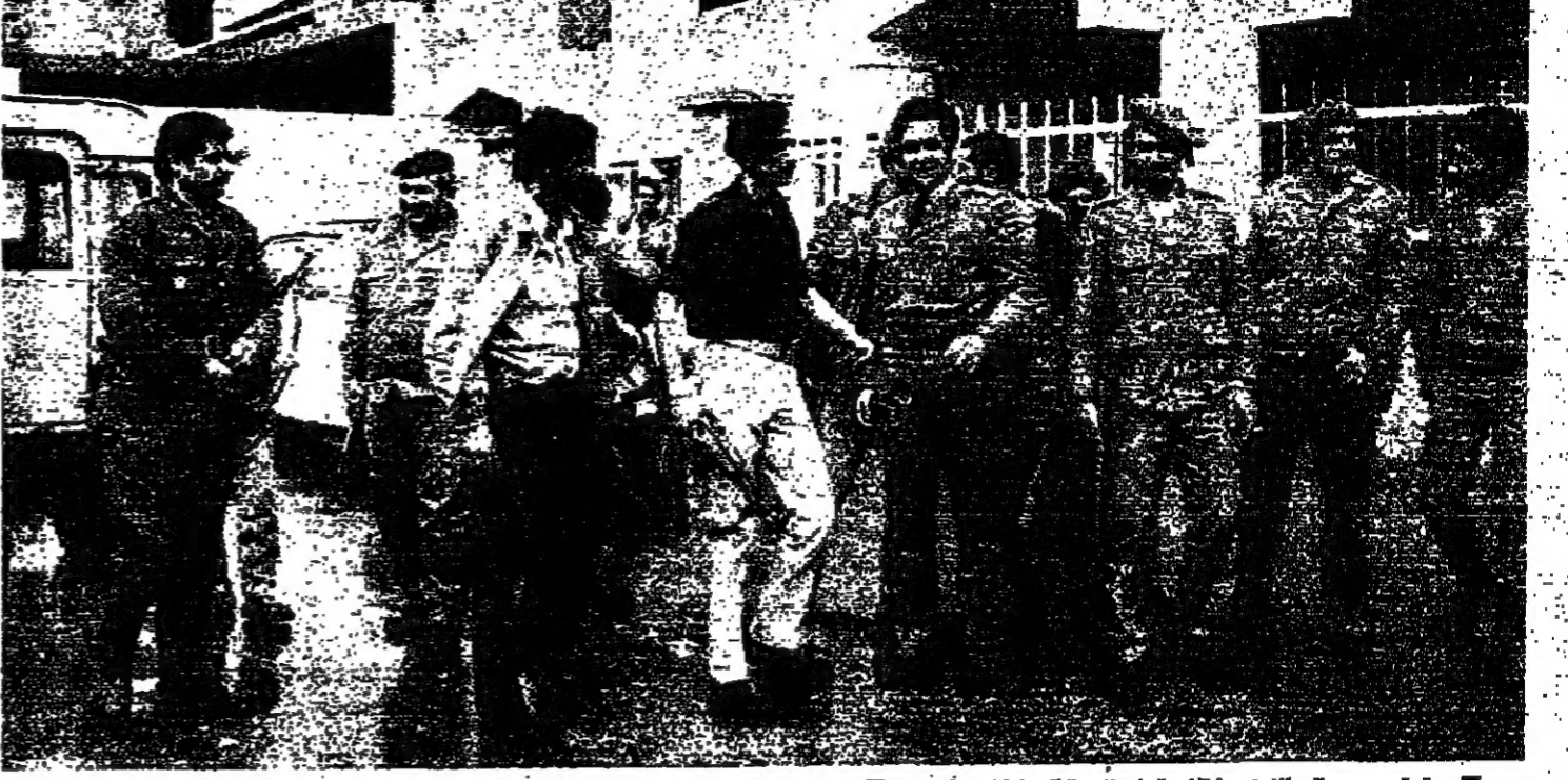
قوة من رجال الأمن والقوات المسلحة في «حارة حريك» أمس

عرفات يتصل بفرنجية ويشكره على موقفه الايجابي كرت «وكالة الأنباء الفلسطينية» وكرت «وكالة الأنباء الفلسطينية» (ونا) ان السيد ياسر عرفات أجرى اتصالاً هاتفياً مع الرئيس فرنجية الإيجلي الذي وقته أثناء الترسمة العملية الجراحية التي أجريت له، وهناء على عودته الى قصر الرئاسة. وقالت «ونا» ان السيد عرفات شكر الرئيس فرنجية على الموقف الإيجابي الذي وقته أثناء الترسمة الأخيرة. ووصف السيد عرفات موقف الرئيس فرنجية بأنه تعبير عن